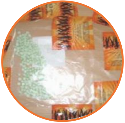
● Sentetik Kannabinoid