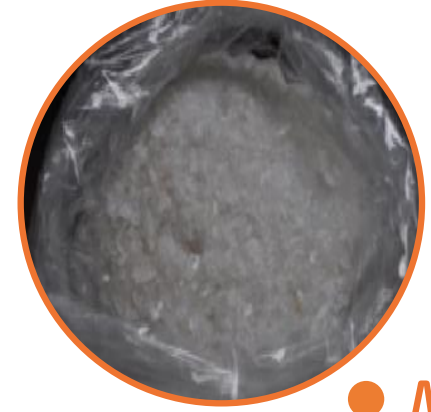
● Meth Maddesi