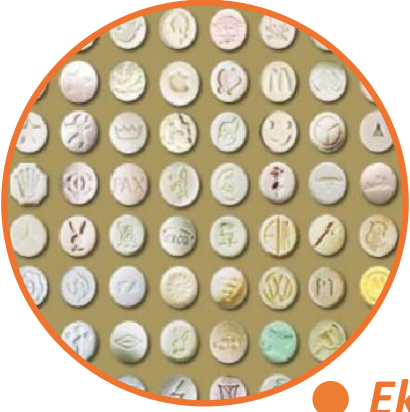
● Ekstasy (MDMA)