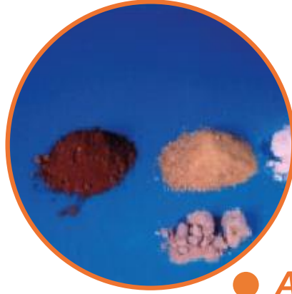
● Afyon Türevleri